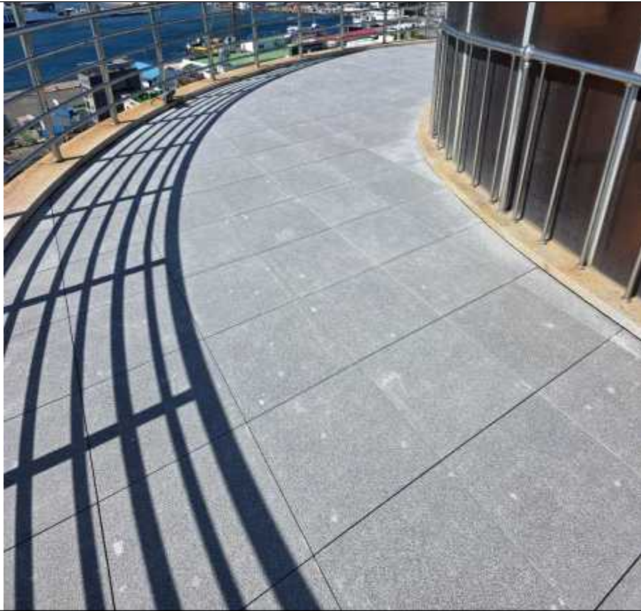
속초등대 전망대 옥상